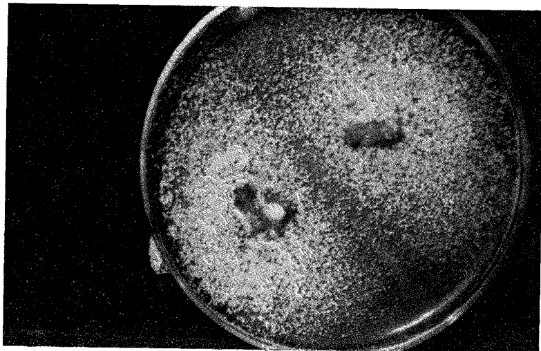
Figura 1 — Colonia de Alternaria tenuis Nees, cultivada en agar papa dextrosa acidulado.