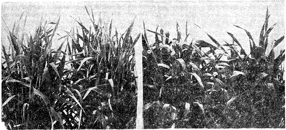
Figura 1 — Efecto del BYDV en plantas de trigo. Izquierda: plantas enfermas; obsérvese menor masa foliar, hojas erectas, delgadas y, además, una mayor precocidad (Estado 10.1 escala de Feekes). Derecha: plantas sanas (Estado 9 escala de Feekes).

A la cosecha se observó que las espigas provenientes de plantas testigos se presentaban llenas, curvadas y de color amarillo oro, con-